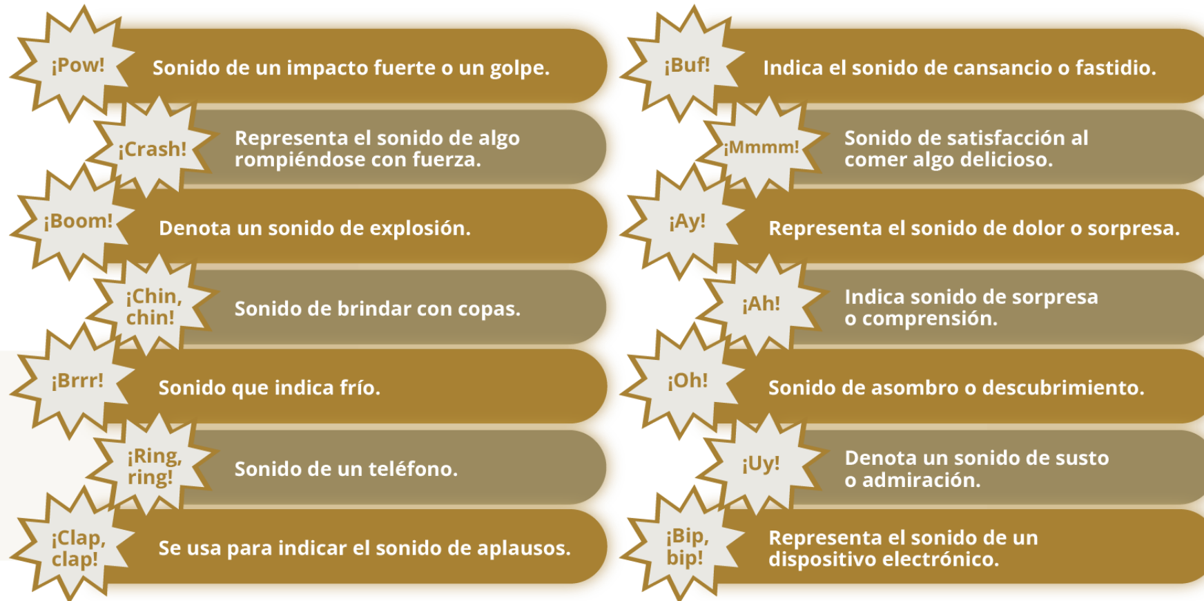
Figura 3. Onomatopeyas usadas en el español.

Estas son algunas de las onomatopeyas más usadas en el español, y que pueden ser usadas en los cómics: