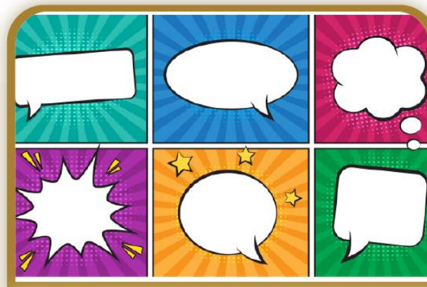
Un globo de texto